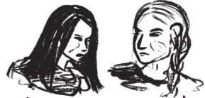
MÈRES ET GRAND-MÈRES

BISPIRITUALITÉ ON TRANSMET CE QUE L'ON CONNAÎT