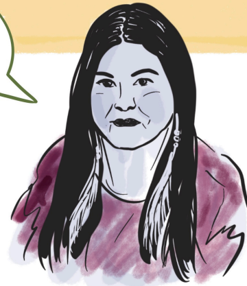
JOURNALISTE MULTI-MÉDIA RÉCIPIENDAIRE DE NOMBREUX PRIX, D'ORIGINE CREE-IROQUIOISE ET FRANÇAISE

AU COURS DE L'HISTOIRE DE L'HUMANITÉ, PLUSIEURS FEMMES ONT UTILISÉ LEUR POUVOIR